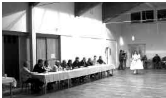
8. 10. 2006 – Česká strana sociálně demokratická, Orlovna