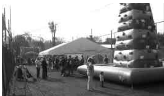
14. 10. 2006 – Strana zelených, u fotbalového hřiště