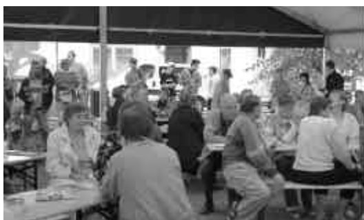
14. 10. 2006 – Občanská demokratická strana, Bosonožské náměstí