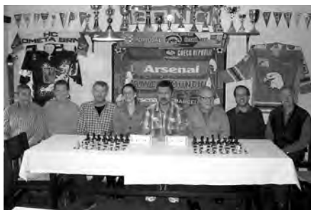
Účastníci turnaje – šachový mistři

Vánoční šachový turnaj – 15. 12. 2012 – pravidelné sváteční setkání šachistů v 1. FC Pivnice.