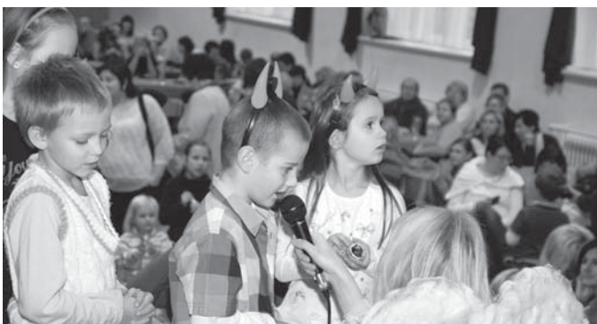
Mikulášská besídka v Bosonohách plná zpěvu, přednesu a dárků (více uvnitř listu)