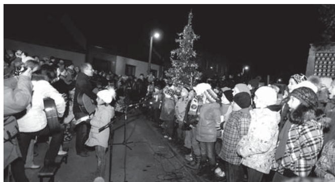
Rozsvícení vánočního stromku – pěvecký sbor žáků místní školy pod vedením učitelů ZŠ Bosonožské nám. (dělají nám radost :-)).