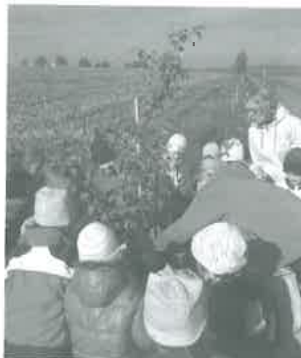
Děti školky při sázení okrasných stromků