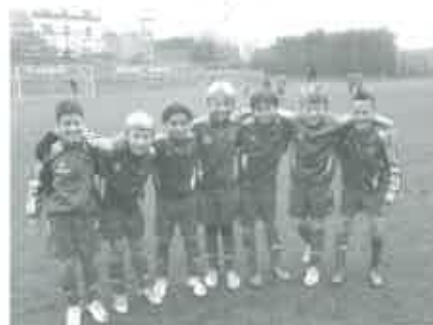
Mladí hráči SK Rapid Vídeň