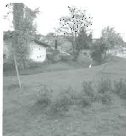
Jedna z nově upravených částí Bosonoh – křížovatka Pražská x Hoštická