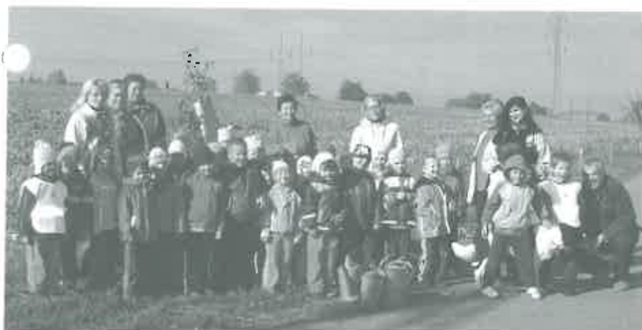
Na cestě od ulice Hoštická k „poldru“ (k myslivně)