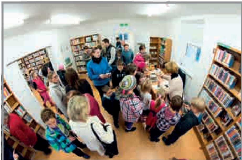
Slavnostní setkání v knihovně