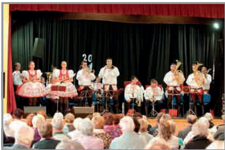
Kapela Mistříňanka na setkání k výročí Senior klubu Bosonohy