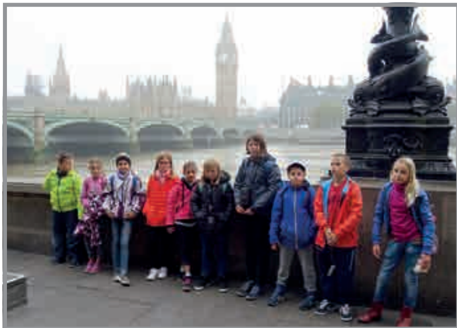
Zahraníční pobyt v Anglii