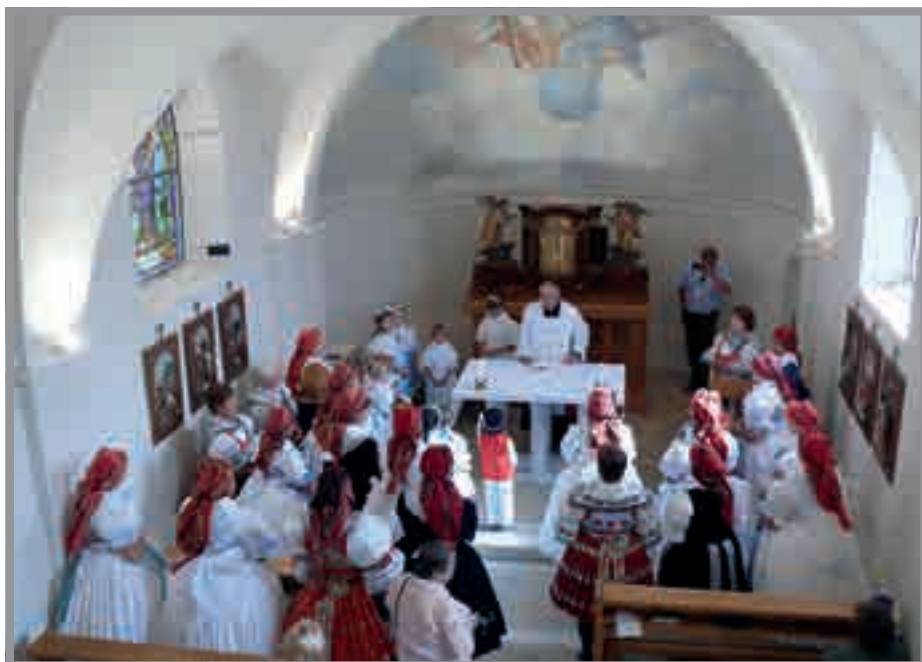
Babské hody 2015