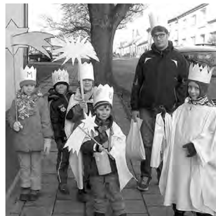
Tříkrálová sbírka přispívá k upevnění solidarity mezi lidmi.

Druhý lednový víkend se opět v ulicích Bosonoh rozezněly kroky a zpěvy malých a velkých koledníků, kteří přišli do vašich domovů s poselstvím tříkrálové sbírky. Tato sbírka by se měla v první řadě stát příležitostí k setkání všech lidí s radostnou vánoční zprávou o narození Spasitele Ježíše Krista skrze návštěvu tří králů. Koledníci jsou vyslanci Boží lásky. Jejich návštěva vám umožní se podílet na pomoci těm, kteří ji potřebují.