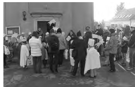
Pořadatelé sbírky oznamují, že při koledování v sobotu 11. 1. 2014 byla v naší obci vybrána částka 50 684 Kč.

Děkujeme vám všem, kteří přispíváte formou tříkrálové sbírky na charitu. A velký dík patří převážně malým a velkým koledníkům, kterých bylo letos požehnaně a také organizátorům sbírky.