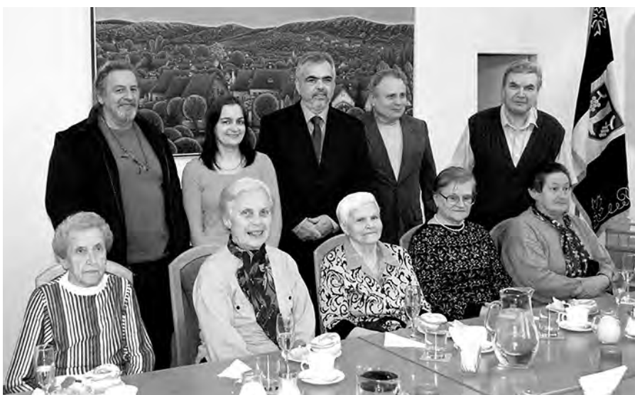
Čtvrtek 16. 1. 2014, 6. setkání bosonožských jubilantů