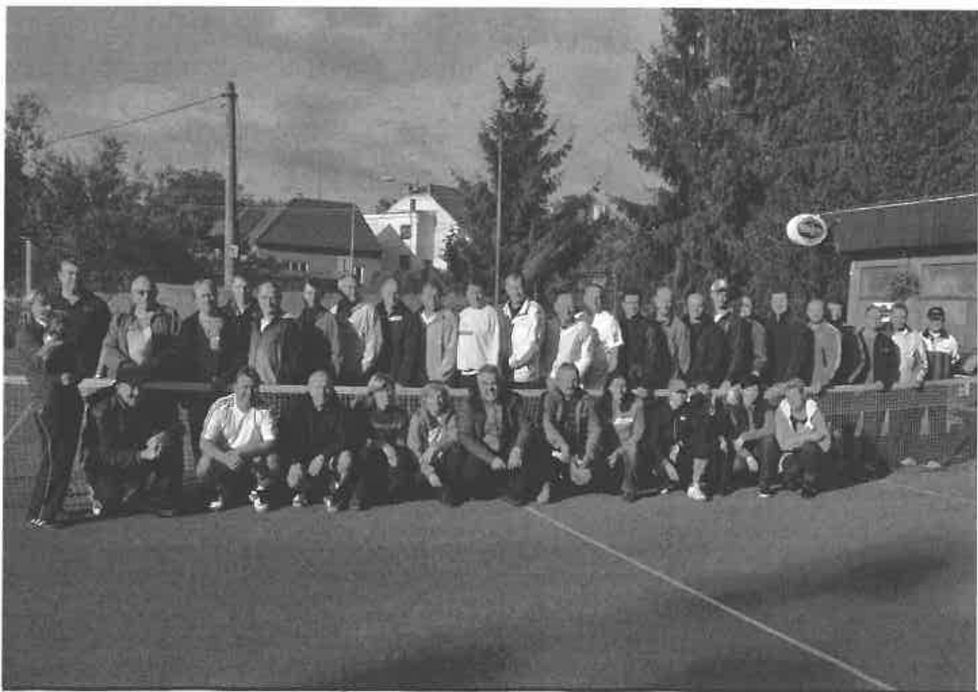
9. ročník – tenisový turnaj „O pohár starosty“