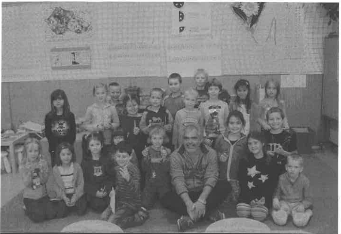
Čtení dětem ZŠ