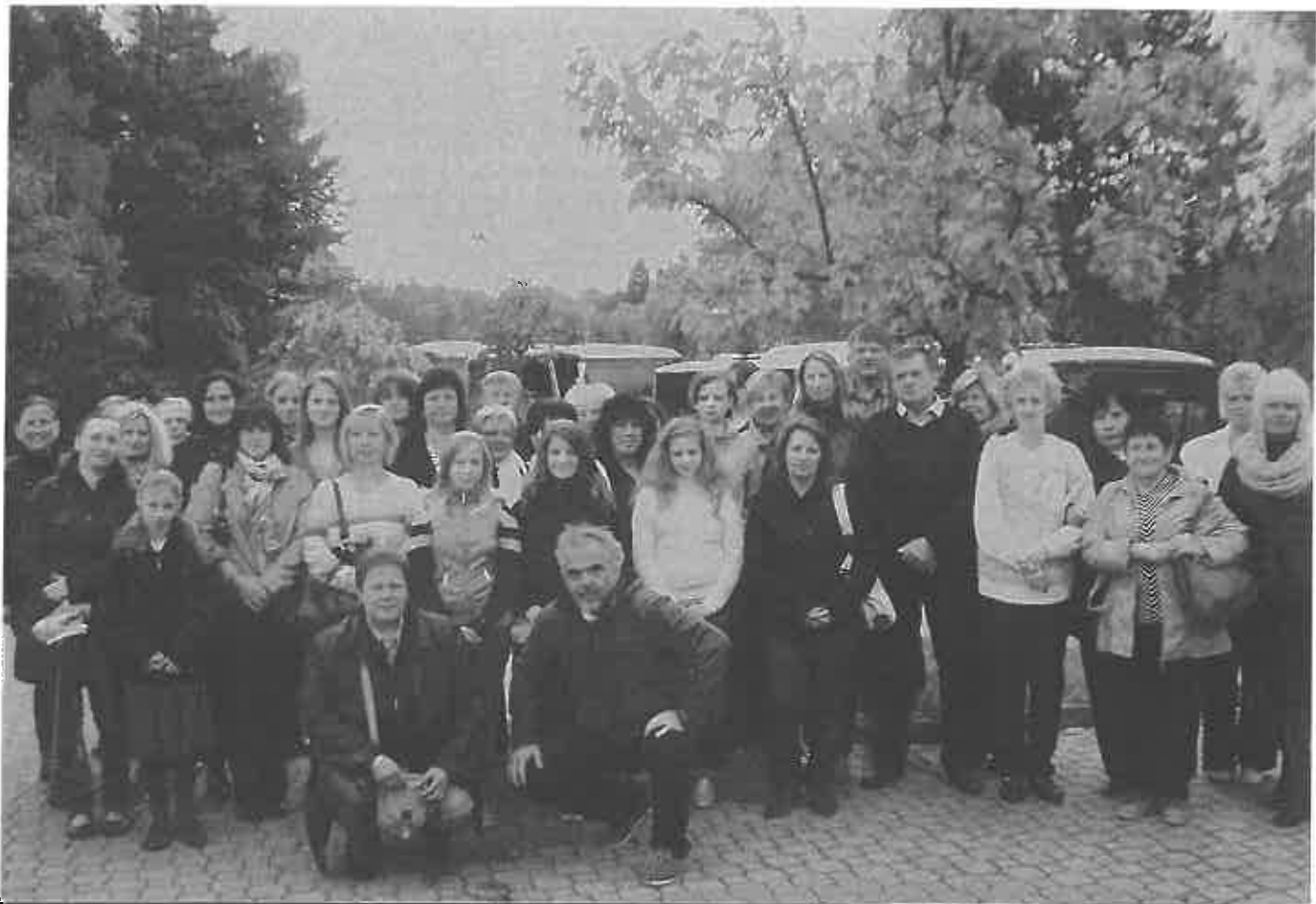
Bosonohy v Praze na výletě za kulturou